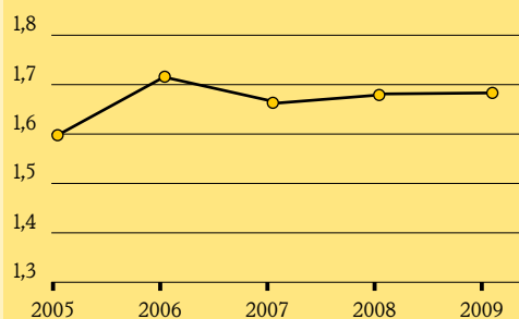
Erlösschmälerungen (in Mio. €)

Zum Bilanzstichtag waren 6,0 % (Vorjahr 6,8 %) der Wohnungen als Leerstand ausgewiesen. Der Anteil des Leerstandes an der Wohnfläche beträgt dabei 6,9 % (Vorjahr 8,0 %). Insbesondere im abgelaufenen Geschäftsjahr kann die Vermietung von Wohnungen mit Flächen ab 90 m 2 als sehr erfolg-